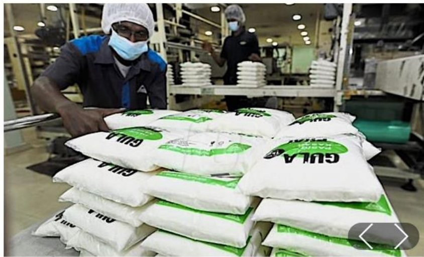
PELAKSANAAN duti eksais untuk minuman bergula 40 sen seliter bermula 1 April 2019 akan memberi cabaran baharu kepada MSM Malaysia Holdings. Bhd. - GAMBAR HIASAN

KUALA LUMPUR 21 Nov. - MSM Malaysia Holdings Bhd. (MSM) mencatat keuntungan bersih RM15.88 juta pada suku ketiga berakhir 30 September 2018, meningkat daripada RM10.42 juta yang direkodkan dalam tempoh sama tahun lepas.