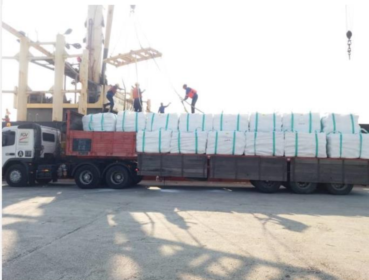
Gula tapis MSM yang diangkut secara pukal cerai di Pelabuhan Tanjung Langsat, Johor

KUALA LUMPUR – MSM Malaysia Holdings Berhad (MSM), pengeluar gula bertapis terkemuka negara mengeksport sejumlah 7,000 tan gula bertapis ke China.